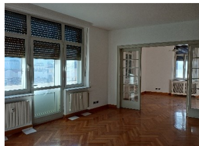
Ampio salone con caminetto e poggiolo, comunicante con la zona pranzo