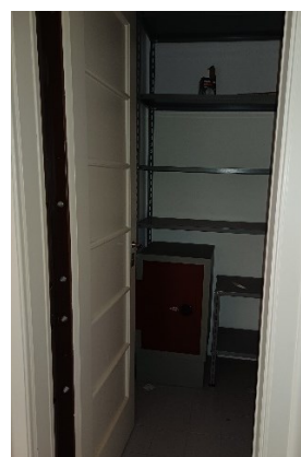
Passaggio dalla zona giorno alla zona notte – studio: ripostiglio con porta blindata e cassaforte