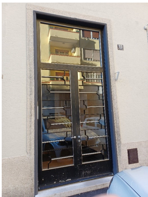
Portone d'ingresso di via Beccaria 13