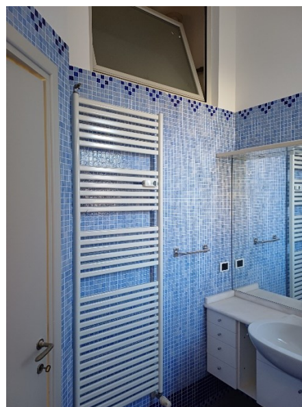
Camera matrimoniale con bagno padronale idromassaggio