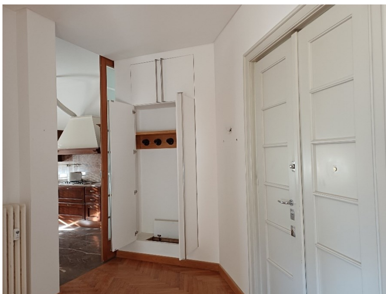
Particolare dell'atrio d'ingresso dell'alloggio con armadio a muro a scomparsa