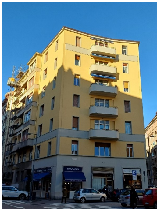
Vista del palazzo da Largo Piave in zona ben servita