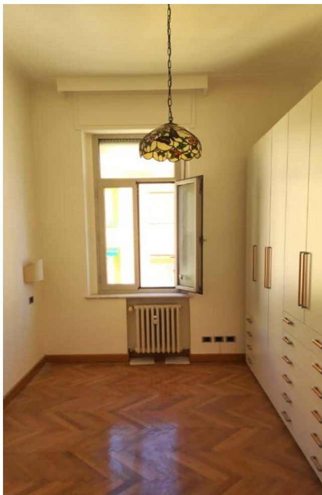
Camera singola con ampia armadiatura su misura