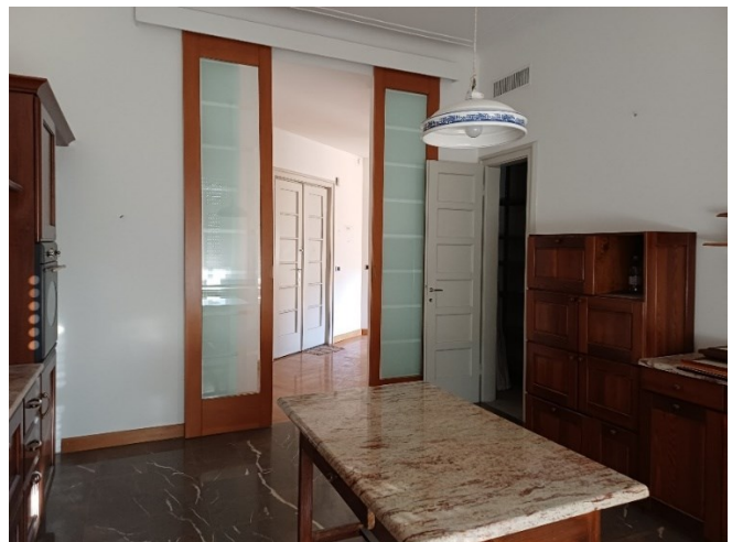
Ampia cucina arredata con annessa dispensa