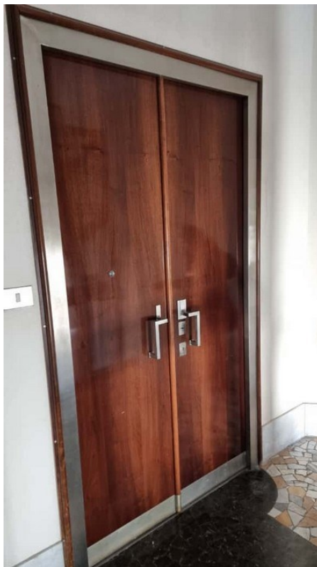
Porta blindata accesso alloggio