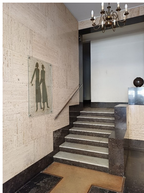
Atrio d'ingresso del palazzo