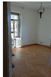
Ampio studio luminoso con doppia esposizione