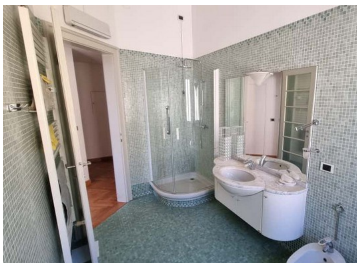
Locale bagno principale